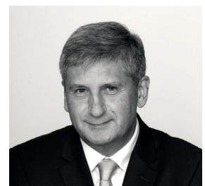
Directeur général Michael Spindelegger

Rendre la migration et la mobilité des personnes ordonnées, sûres et régulières à travers la mise en œuvre de politiques migratoires planifiées et bien gérées.