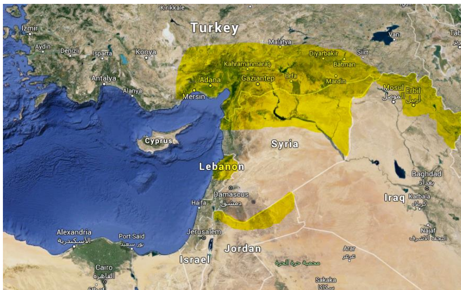
Yerinden edilmiş Suriyelilerin yoğun biçimde bulunduğu bölgeler

Yerinden edilmiş Suriyelilerin çoğunluğu kamplarda yaşamamaktadır.