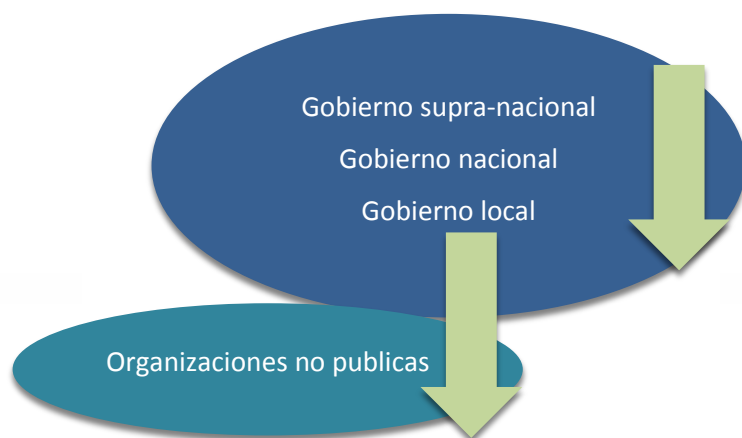
Fig.1 - Procesos arriba-abajo

Beirut es uno de los mayores objetivos del Plan de Respuesta a la Crisis del Líbano, establecido en 2015 por el gobierno central y agencias de la ONU, para coordinar las respuestas internacionales y locales a la crisis de los refugiados. La ciudad de Beirut, como otras municipalidades del Líbano, está implicada indirectamente con el Ministerio de Interior y las Municipalidades que participan en una serie de grupos de trabajo, y directamente como actor principal de los planes de implementación con la sociedad civil y el sector privado.